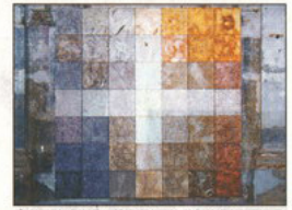
Aldás (2004, akril, vásznon, 350x350 cm)