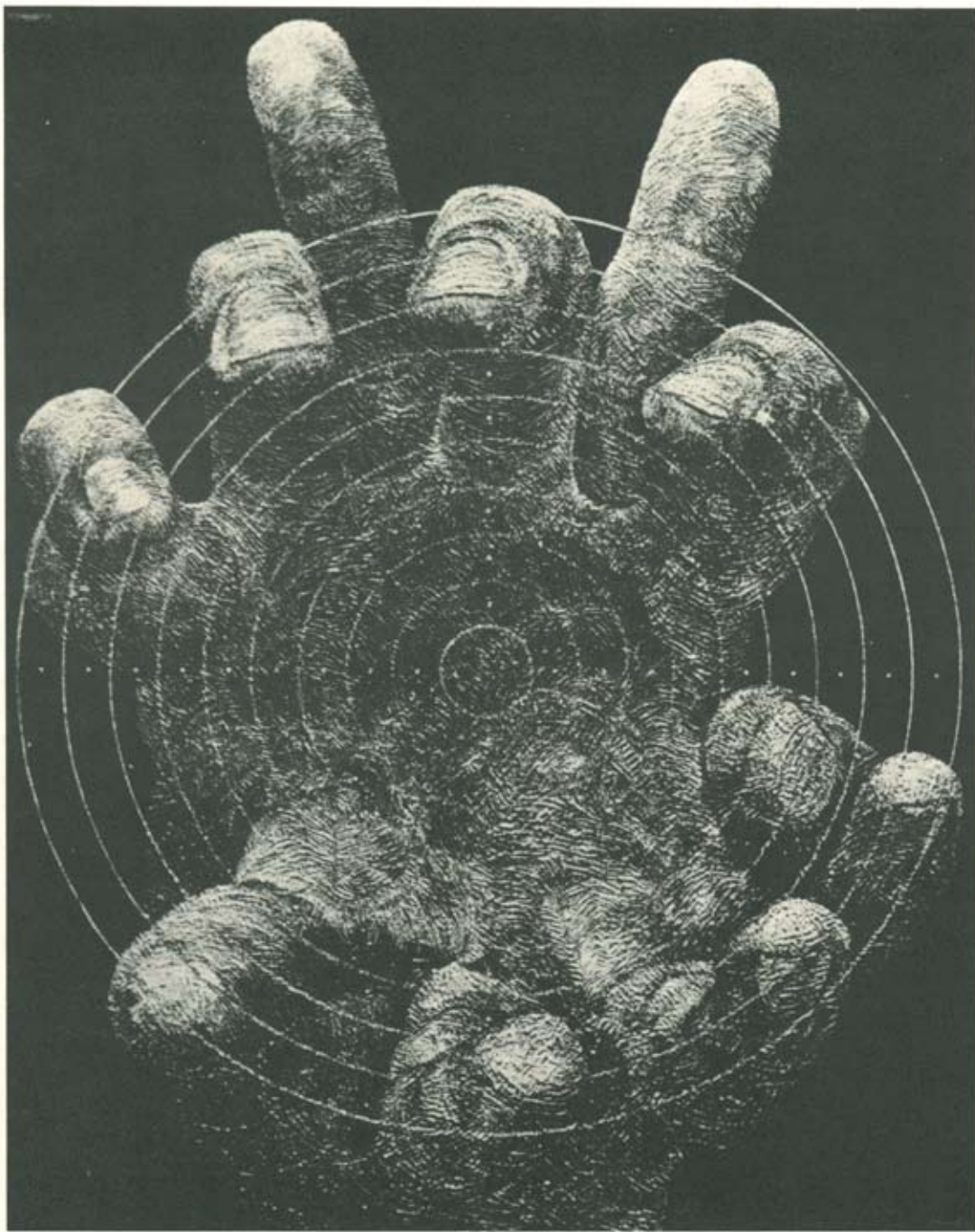
A képlet (vegyes techn.)