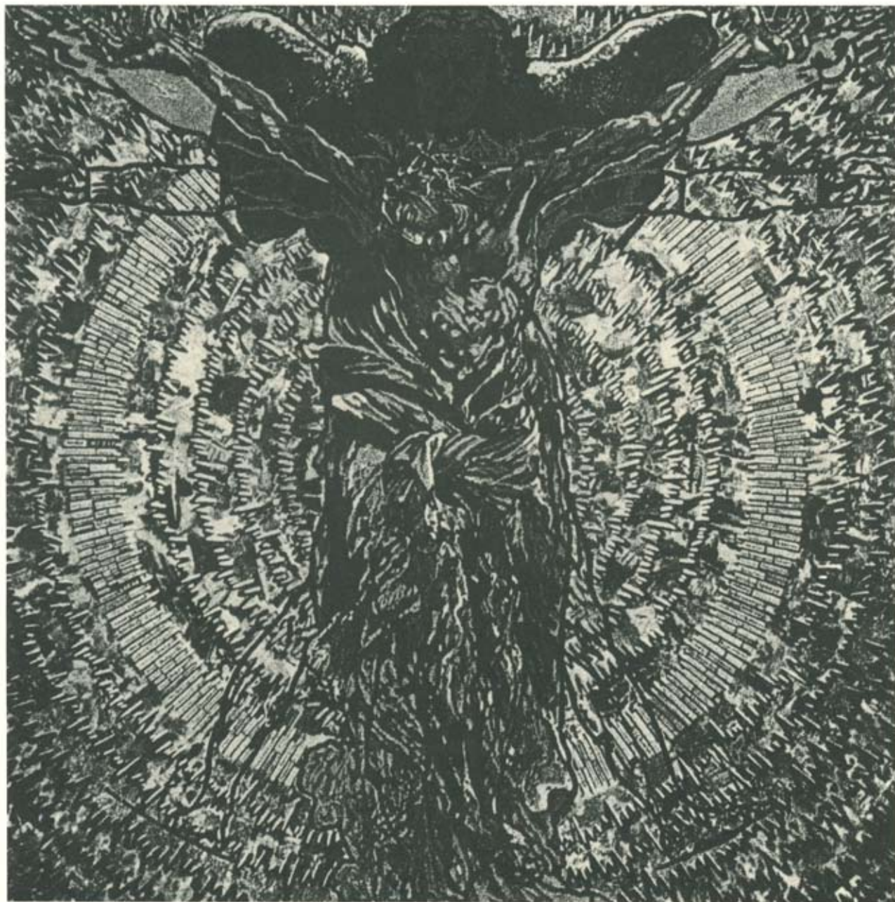
A szörnyeteg (vegyes techn.)