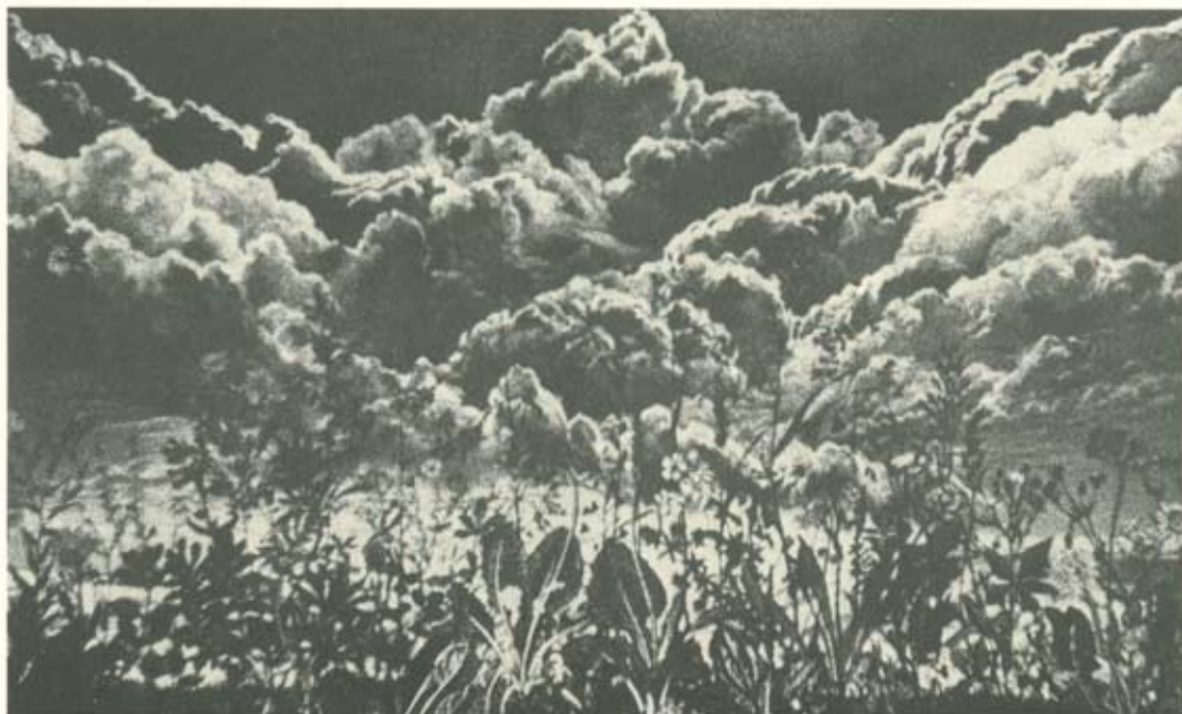
Az idő (olaj)