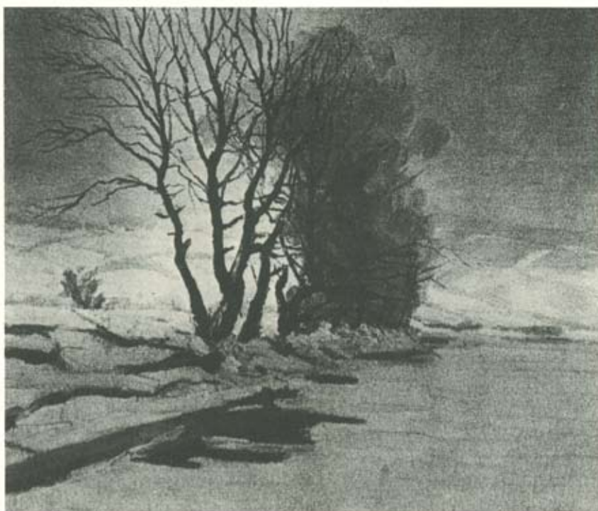
Lila fűzfák (olaj)